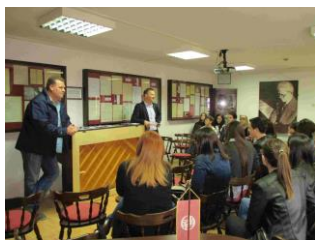
Posjeti Spomen domu