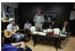
Večer pul Matetićevega ognjišća