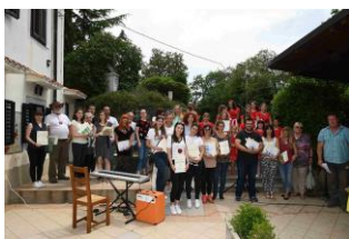
40. Proljeće u Ronjgima

učenici pročitali su svoje radove, a svim učenicima i školama čiji su radovi objavljeni, uručeni su primjerci zbirke.