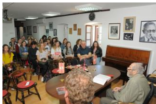
Predavanje učenicima glazbene škole