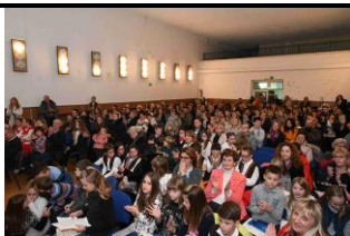
Predstavljanje Čakavčica pul Ronjgi u Hreljinu