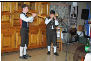
Mantinjada pul Ronjgi