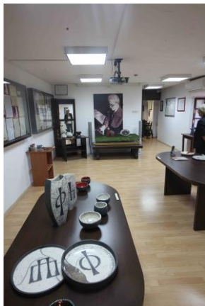
Izložba radova 3. međunarodne kolonije umjetničke keramike