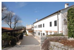
Spomen dom I. M. Ronjgova