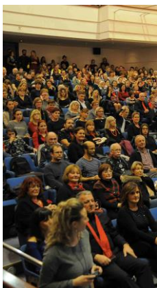
Croatia cantat – Međunarodno natjecanje zborova