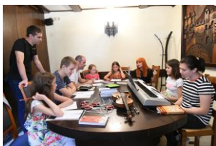
Radionica Mladi skladatelji

U želji da se održi autohtoni glazbeni izraz Primorja i Istre – svirka sopela, roženica, miha, šurli i dvojnica kao i kanat u dvojce "na tanko i debelo", Ustanova svake godine, u povodu Dana sv. Mateja organizira Mantinjadu pul Ronjgi. Manifestacija je natjecateljskog karaktera, na kojoj sudjeluju mladi sopci i kanturi do 22 godine starosti. Ovogodišnja 37. manifestacija Mantinjada pul Ronjgi okupila je kod Matetićeve rodne kuće sopce i kanture iz Istre i Hrvatskog primorja.